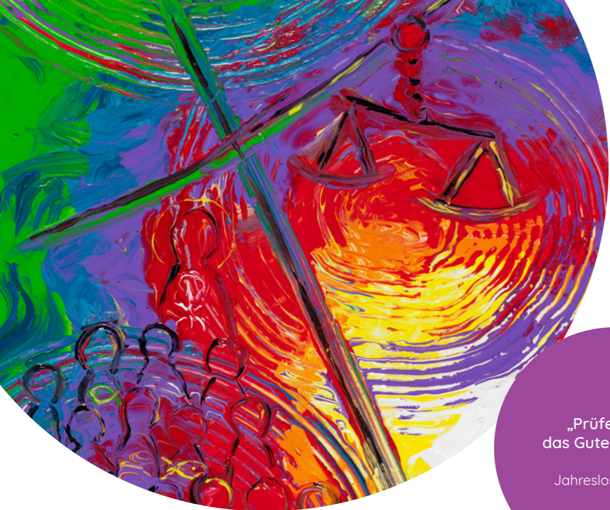
Acrylmalerei von Doris Hopf © Gemeindebriefdruckerei.de