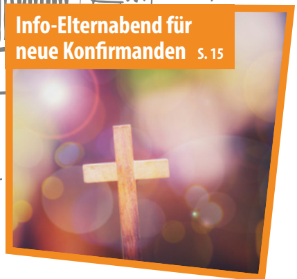
Info-Elternabend für neue Konfirmanden s. 15