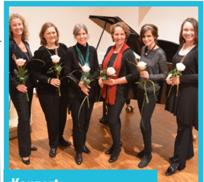
Konzert: Ensemble Tredici s. 5